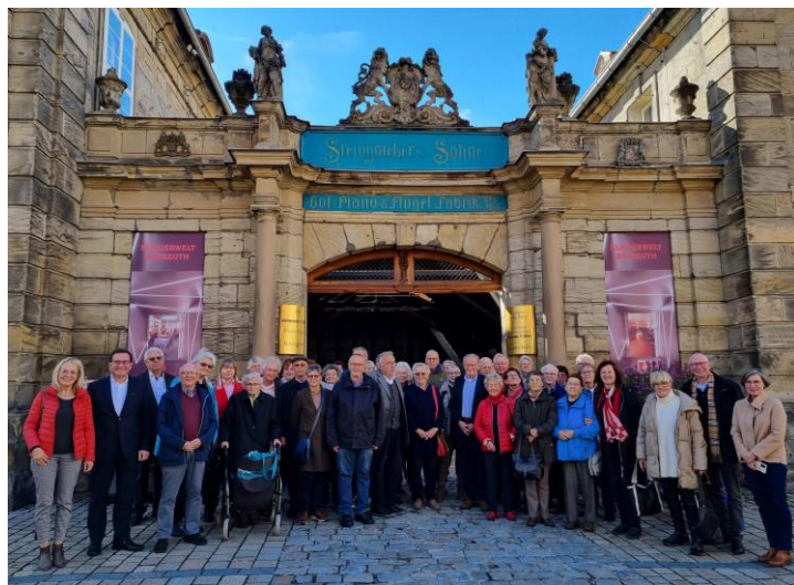
Gruppenbild der Senioren vor der Klaviermanufaktur Steingraeber & Söhne in Bayreuth